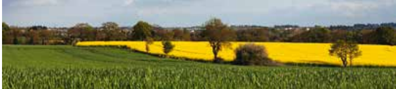
#Bretagne #Rennes #CessonSévigné #ThorignéFouillard