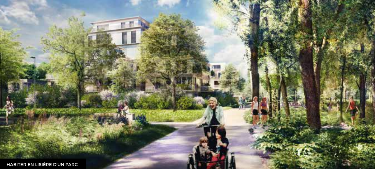
HABITER EN LISIÈRE D'UN PARC