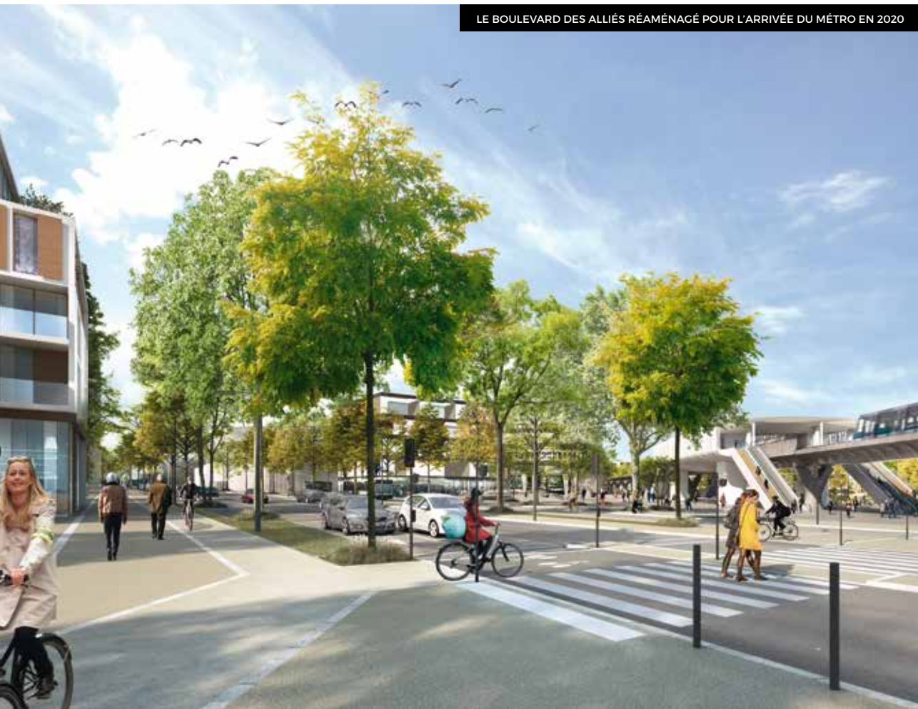
LE BOULEVARD DES ALLIÉS RÉAMÉNAGÉ POUR L'ARRIVÉE DU MÉTRO EN 2020