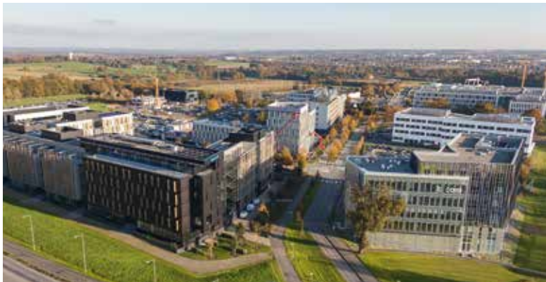
#ÉcoCité #ViaSilva #LesPierrins #AtalanteViaSilva #métro #connecté