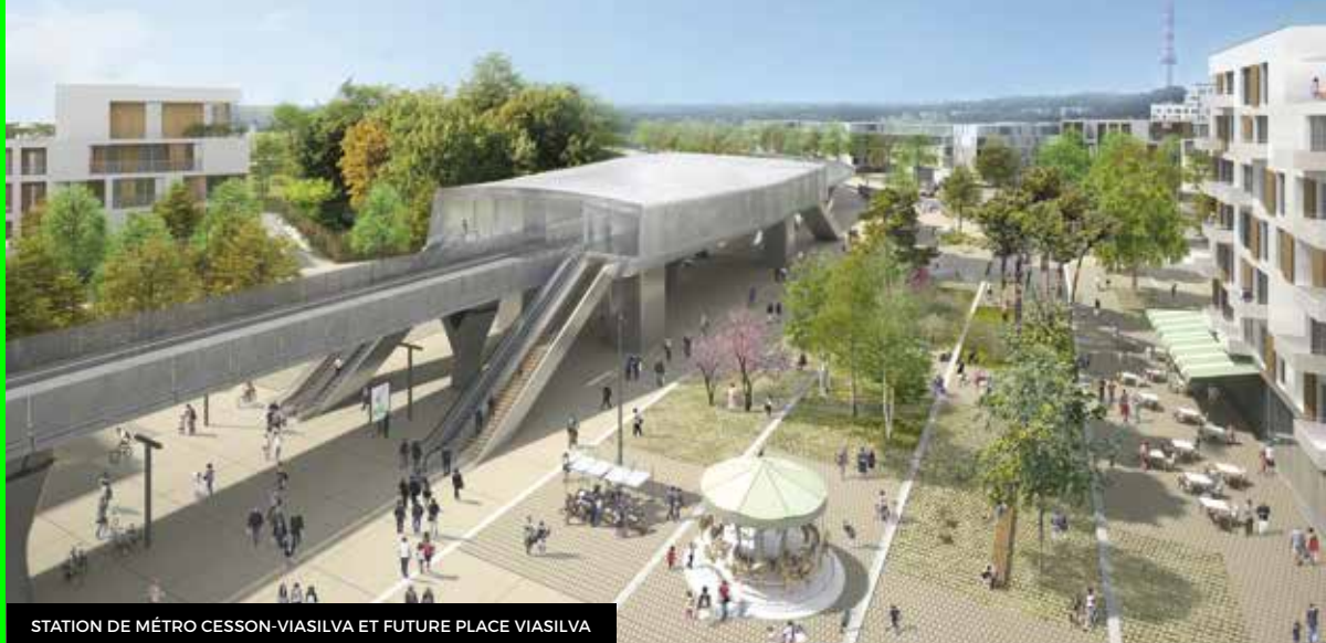
STATION DE MÉTRO CESSON-VIASILVA ET FUTURE PLACE VIASILVA